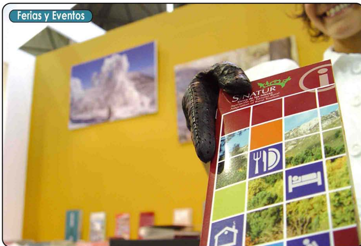
Una azafata muestra el folleto de la Asociación Sinatur en el stand de la Ferantur