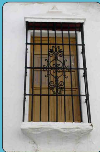
Detalle de una reja en el transcurso del recorrido

Este camino nos sumerge en un paraje natural sorprendente, con extraordinarias vistas a La Torrecilla, al Tajo de la Caina, al Cerro Corona, y por su puesto, al bosque de pinsapos más importante de Europa.