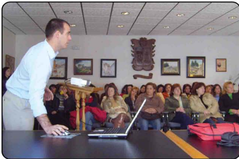
Un momento de la presentación en el Ayuntamiento de Yunquera

Durante el mes de marzo, y sin apenas haber comenzado la difusión del Plan de Acciones Experimentales en la Sierra de las Nieves, ya se han logrado las primeras doce inserciones en el mercado laboral. Además de gestionar estas nuevas incorporaciones, los técnicos encargados de este proyecto han realizado diferentes actividades para potenciar la preparación y cualificación de las diferentes usuarias de cara a su posterior inserción en el trabajo. Talleres para la preparación del Currículum Vitae o de cómo afrontar una entrevista laboral,